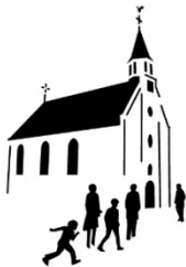
Protestantse Gemeente te Odijk